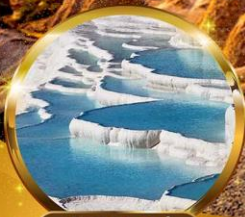
ปามุคคาเล่