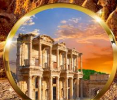
หอสมุดเซลซุส