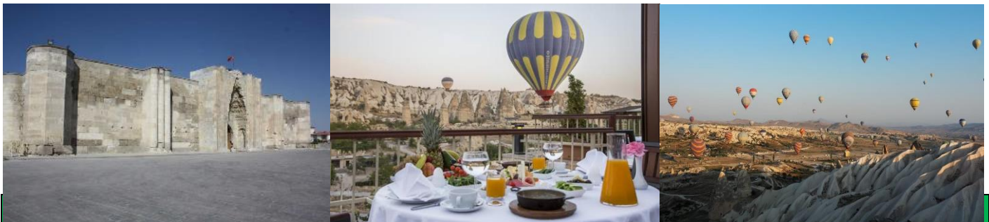
รับประทานอาหาร (พร้อมเครื่องดื่มไม่แอลกอฮอล์)

ที่พัก โรงแรม Burcu Kaya S class ระดับ 4 ดาว หรือเทียบเท่า